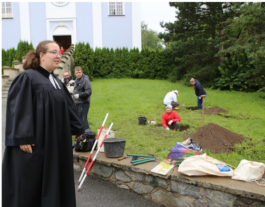
Obr. 6. Sondáž před kostelem českobratrské církve evangelické (zbudován v letech 1837-1844).

(moderní terénní úpravy návsi v 70. letech 20. století). V sondách 10-12 nebylo podloží dosaženo (max. hloubka dosažena v sondě 10 činí 2 m) a je pravděpodobné, že v severovýchodní části dnešní návsi se nacházela úžlabina (koryto vodoteče?). Jamky po dřevěných vertikálních konstrukčních člancích, další zahlužené objekty i spáleništní situace indikují zástavbu neznámého charakteru v této části dnešní návsi a její komplikovaný vývoj. Ve vzdálenosti 5 m před průčelím domu čp. 109 (původně součást vrchnostenského dvora) byla pod mocnými vrstvami zahradních navážek zachycena hrana suterénu vylámaného do pískovcové skály orientovaného od západu k východu, tedy kolmo k dnešnímu okapově orientovanému stavení. Svědectví starších obyvatel Vanovic dokládá přítomnost sklepů v této části návsi (některé byly odhaleny a následně zasypány při terénních úpravách v 70. letech).