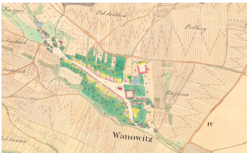
Obr. 1. Vanovice na císařském otisku mapy stabilního katastru ( https://archivnimapy.czukz.cz/uazk ).

Mapa stabilního katastru zachycuje ves s trojúhelníkovou návší, z níž vybíhají komunikace k SZ, JV a SV. V jádru pozdně gotický kostel sv. Václava je situován ve střední části návsi na terénní hraně a velký čtyřstranný dvůr zaujímá její východní stranu (zčásti dochován v mladších přestavbách; považován za původní rychtu). Vrchnostenský dvůr se nachází na severovýchodním okraji vsi. V 19. a 1. polovině 20. století se Vanovice výrazně rozrostly severozápadním směrem, kde se stal dominantou pozdně empírový evangelický kostel z let 1837–1844 (Barotová – Paroulek 2004).