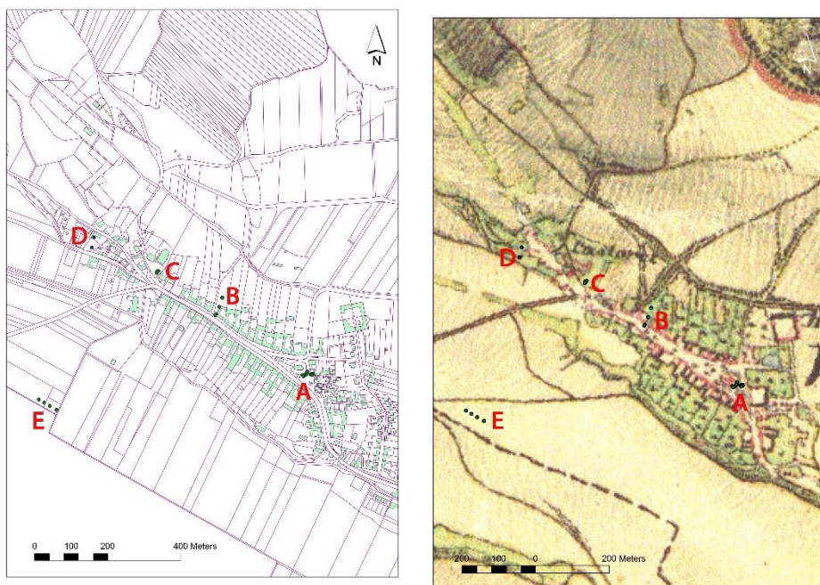
Obr. 3. Sondáž ve Vanovicích (vlevo – současná mapa obce, vpravo – II. vojenské mapování z 1. poloviny 19. stol.). A – sondy 8-13, B – sondy 14-17, C – sondy 5-7, D – sondy 1-2, E – sondy 3-4, 18-19.

období je zastoupeno bronzovým závěskem ve tvaru kola (Vích 2017b, 644). V prvních stoletích po Kristu dokládá intenzivní produkci železa zkoumaný železářský areál a další aktivity indikují nálezy spon a mincí (Droberjar – Jarůšková 2017, s. 41-42, obr. 159-162).