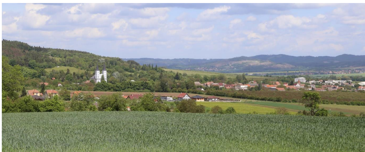
Obr. 2. Vanovice. Pohled od jihozápadu.

Nejstarší archeologické nálezy z okolí obce se řadí již do středního paleolitu, a sice micocienská industrie z katastru sousedních Knínic a naleziště spongolitových levalloiských jader u nedalekého Bačova. Aurignacienské nálezy z mladšího paleolitu známe z katastru sousední obce Světlá (Oliva 2014, 25-41).