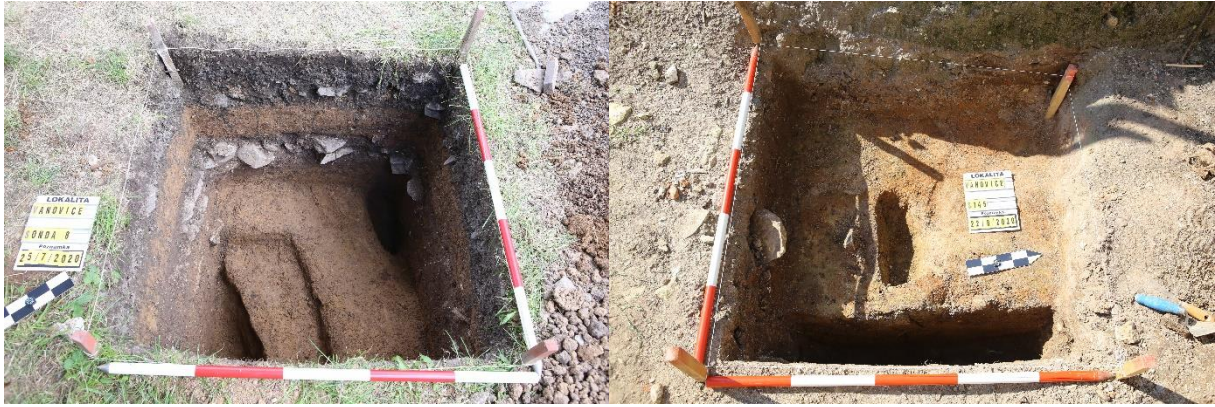
Obr. 5. Vlevo – objekty ze 14.-15. století zahlužené do středověké úrovně návsi; vpravo – sloupová jáma v čele usedlosti čp. 11 (pozůstatek stavby nebo ohrazení z pozdního středověku-časného novověku).

(moderní terénní úpravy návsi v 70. letech 20. století). V sondách 10-12 nebylo podloží dosaženo (max. hloubka dosažena v sondě 10 činí 2 m) a je pravděpodobné, že v severovýchodní části dnešní návsi se nacházela úžlabina (koryto vodoteče?). Jamky po dřevěných vertikálních konstrukčních člancích, další zahlužené objekty i spáleništní situace indikují zástavbu neznámého charakteru v této části dnešní návsi a její komplikovaný vývoj. Ve vzdálenosti 5 m před průčelím domu čp. 109 (původně součást vrchnostenského dvora) byla pod mocnými vrstvami zahradních navážek zachycena hrana suterénu vylámaného do pískovcové skály orientovaného od západu k východu, tedy kolmo k dnešnímu okapově orientovanému stavení. Svědectví starších obyvatel Vanovic dokládá přítomnost sklepů v této části návsi (některé byly odhaleny a následně zasypány při terénních úpravách v 70. letech).