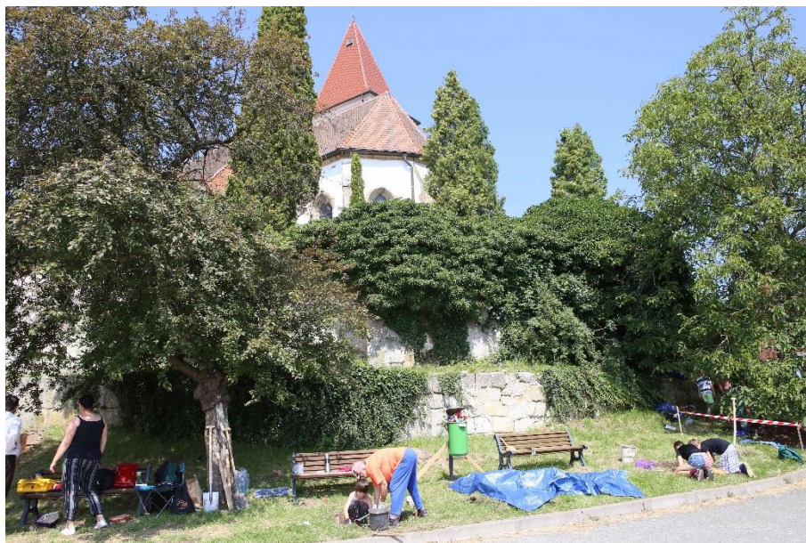
Obr. 4. Sondáž na návsi jihovýchodně od gotického kostela sv. Václava.

okapově orientovaného domu; sonda 15 a 17) a v zahradě (sonda 14 a 16). V tzv. „Horním konci“ obce protály tři sondy terasu před evangelickým kostelem (sonda 5-7) a dvěma dalšími byla zkoumána parcela domu čp. 155 (dvůr a zahrada; sondy 1 a 2). Poslední 3 sondy (S3-4, 18-19) byly vyhloubeny v extravilánu na zemědělsky obdělávané ploše (parcely 448/2 a 448/3) na hřbetu mezi Vanovicemi a Drválovicemi, cca 490 m jihozápadně od evangelického kostela, a to na žádost obce (na předmětných obecních pozemcích je plánována výstavba rodinných domků a výzkum tak měl charakter zjišťovací).